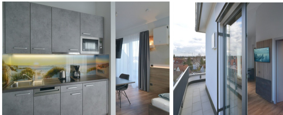
Bilder: Wohnbereich, Kitchenette, Dachterasse, Bett